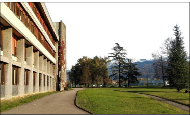
BÂTIMENT STENDHAL Projet SMART CAMPUS Humanités et Langues